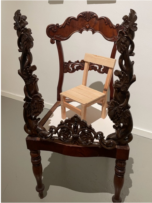
Gammal och ung möbelkonst