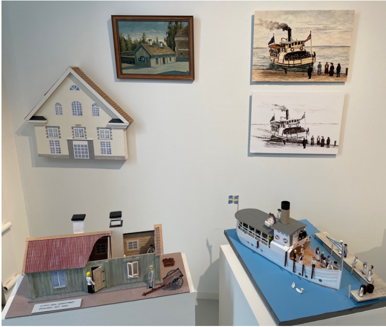
Torshällas kvarn- och sjöfartshistoria