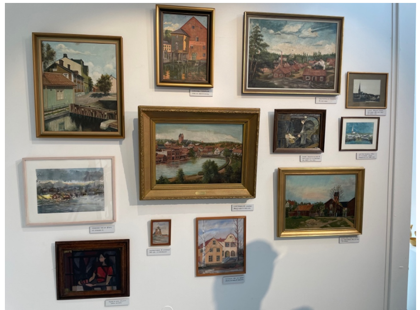
Tavlor målade av Torshällas egna konstnärer