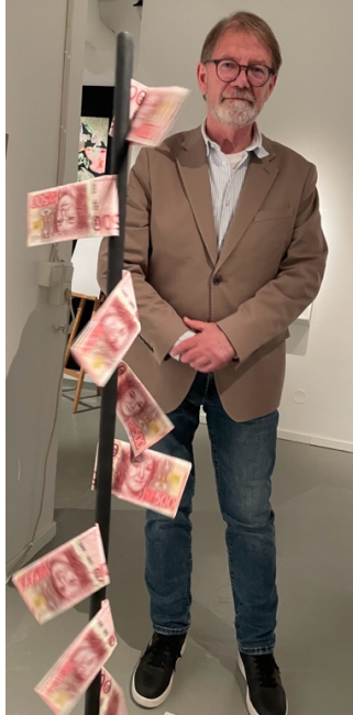
Roterande toalettpapperssedlar av Hans Henningsson