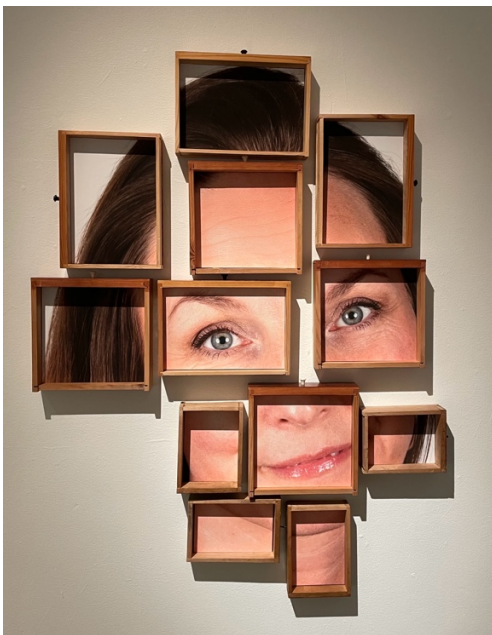
Återbruk av bl. a. gamla skrivbordslådor