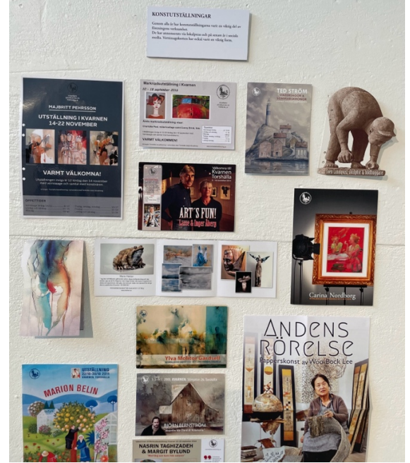
Konstföreningens kavalkad över konstutställningar de senaste åren