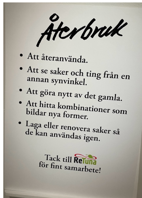
Välkomsttavlan Återblick , med Torshällas dräkter till 700-årsjubileet, och Återbruk