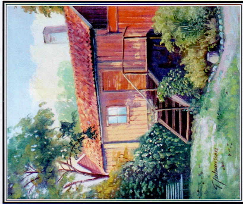
Gammalt hus vid Holmberget från omkring 1900