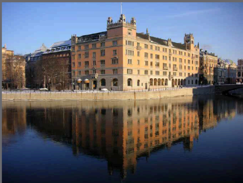
Dagens regeringskansli Rosenbad i Stockholm byggdes av Lars Linus Liberg 1902 (bild av Holger Ellgaard)

Upp- och nedgångar påverkades inte bara av konjunkturen