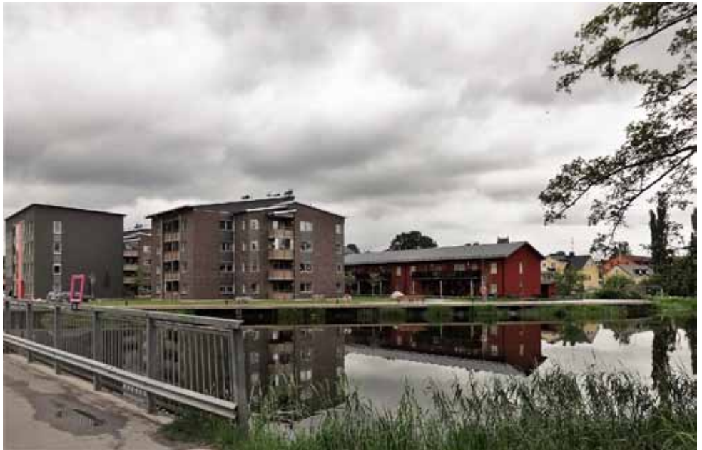
Nedan: ett helt nytt bostadsområde