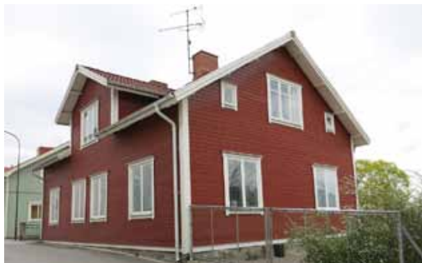
Gården Sommarro nr 6