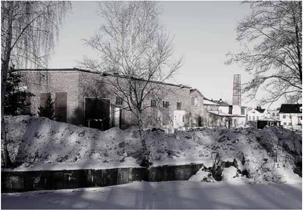
Ovan: Holmens fabriksbyggnader