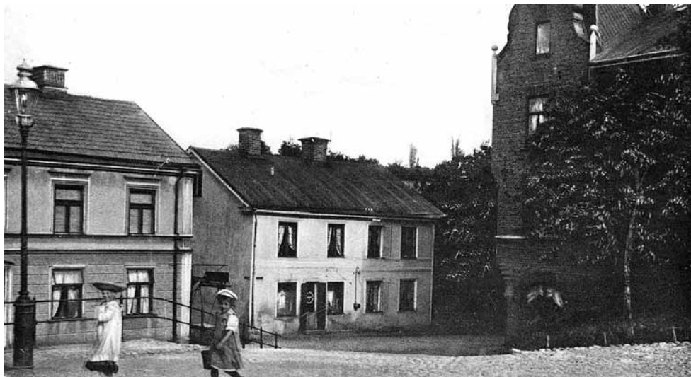
Storgatan tidigt 1900-tal