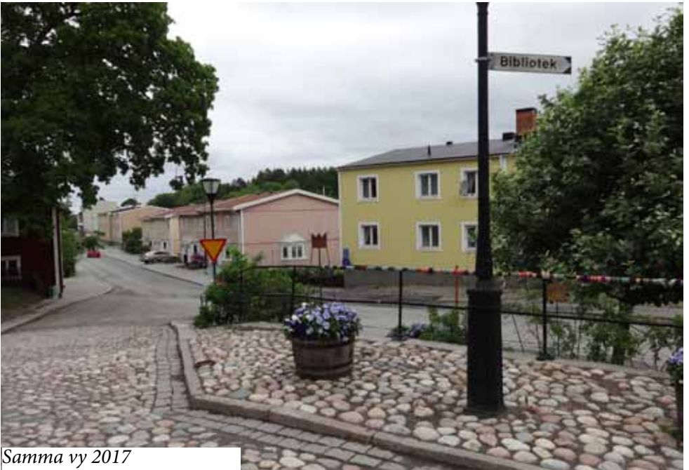
Samma vy 2017