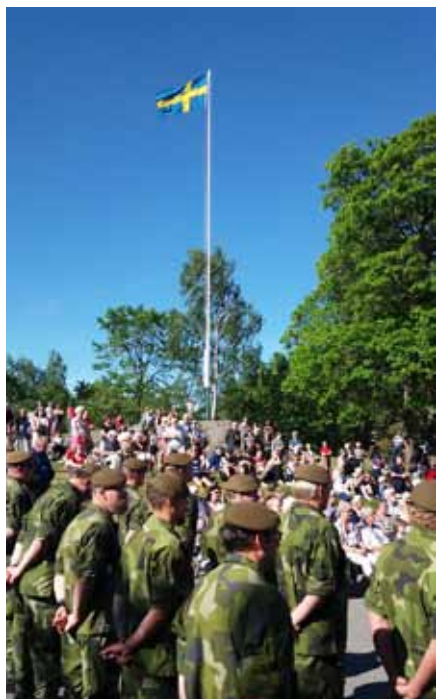
Holmberget den 6 juni

Detta minnesmärke finns nu på Bergströmska gården