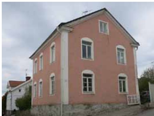
Gården Sommarro nr 4