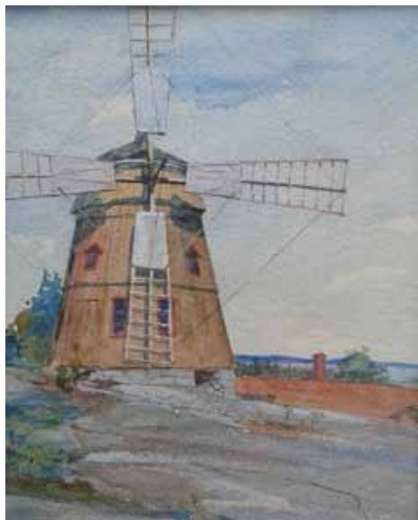
Kvarnen i Torshälla. Akvarell av Sibbe Malmberg 1894

Vid årets konstrunda hade Bergströmska gården en tavelutställning med motiv från Torshälla. Ur gömmorna kom då denna lilla akvarell fram. Den är målad av Sibbe Malmberg år 1894.