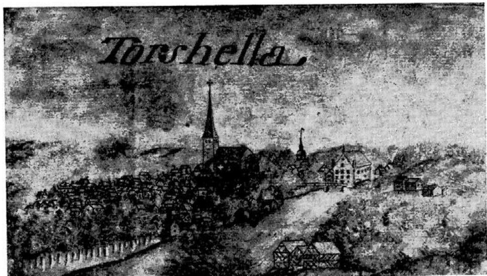
Gripenhielms stadsvy över Torshälla.

Bilder och böcker finns att studera på Torshälla Antikvariat.