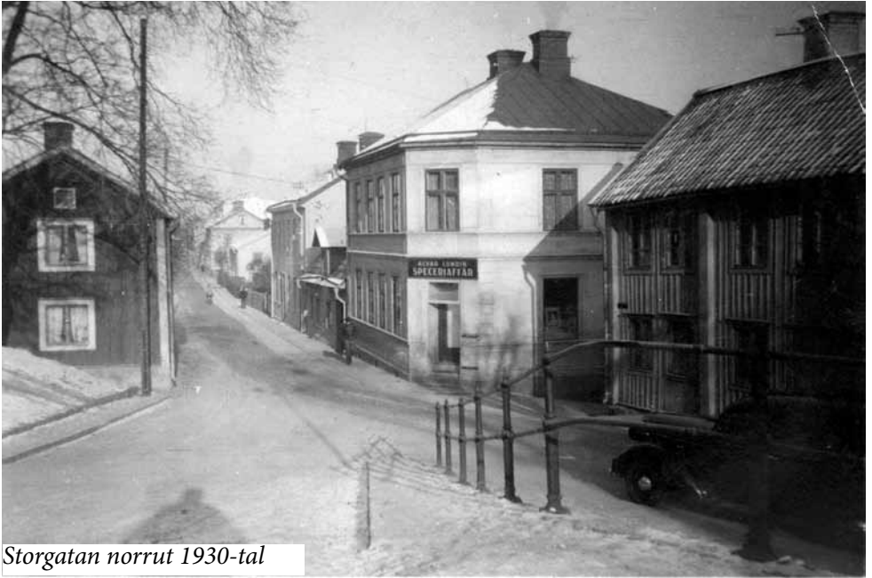
Storgatan norrut 1930-tal