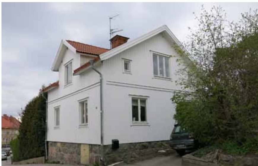
Gården Sommarro nr 5