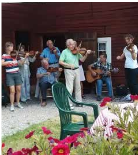
Sommarprogrammet avslutades med uppskattad underhållning av Djurgårdens spelmannslag.