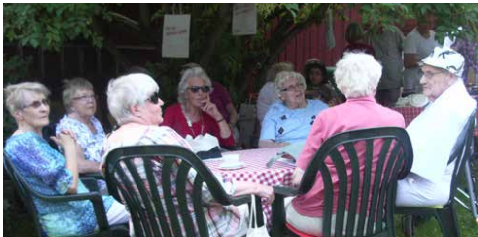
Varje torsdag under sommaren kom dessa trevliga damer till Bergströmska gården.