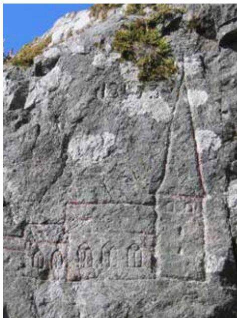
Ristningen över kyrkan med dess höga spira inhuggen i Husstenen jämte datumet för branden.

Det finns ett flertal tidiga avbildningar av gamla kyrkan. Johan Peringskiölds teckning av kyrkan från år 1686 ger en god bild av tornets smäckra utseende. Den mest kända avbildningen torde vara Erik Dahlbergs vy över Torshälla i Svecia antiqua et hodierna från 1715.