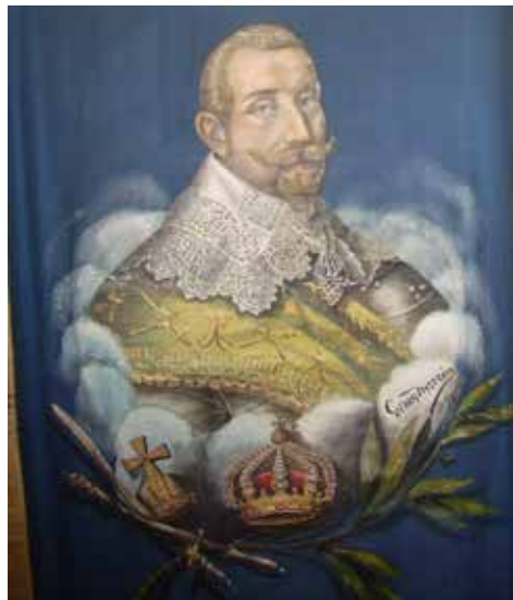
En vacker målning av Nyström

Nyström var också en skicklig fotograf och målare. År 1892 öppnade Georg Nyström Artistisk och fotografisk ateljé vid Storgatan 18, i ”Dogepalatset”. Där inredde han fotoateljé och rum för standar-/ och fänmålning. Flera hundra standar och fanor tillverkades, framförallt till de många IOGT-loger och Blåbandsföreningar som bildades i slutet av 1800-talet. Som regel fotograferade han av sina alster innan de levererades.