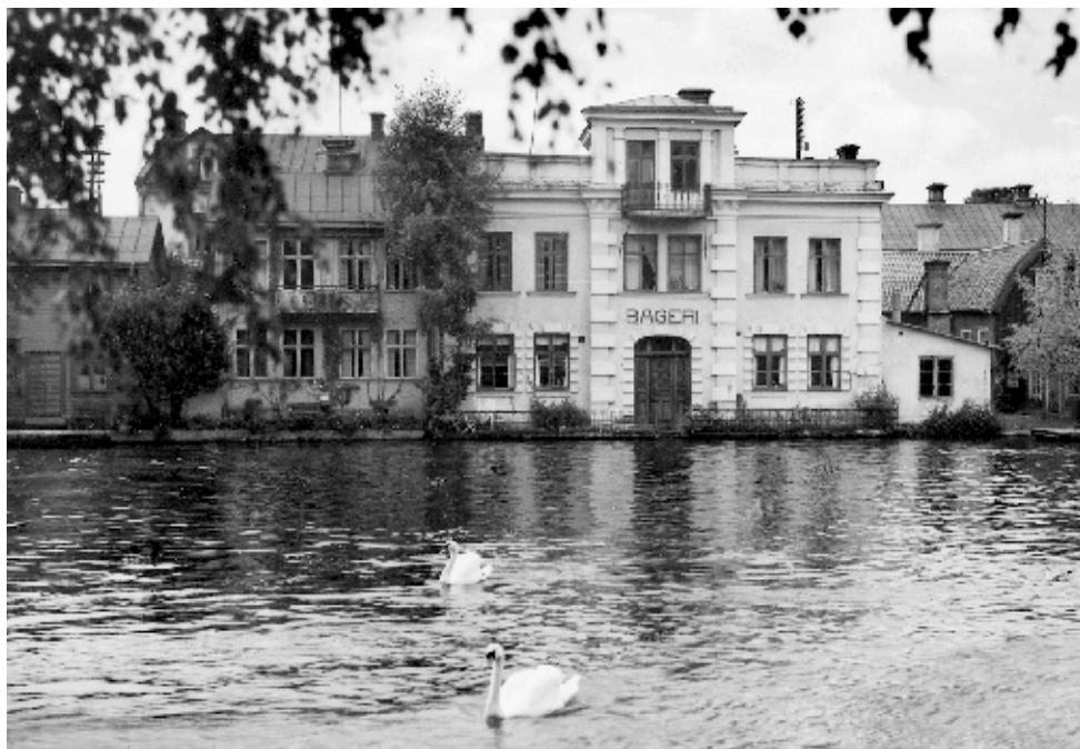
”Dogepalatset”, vy från Holmbergsparken 1930-tal.

År 1783 gjorde Hans Graf en inventering av Torshällas alla gårdar och vid den tidpunkten ägde borgare Nils Lundholm gården nr 17.